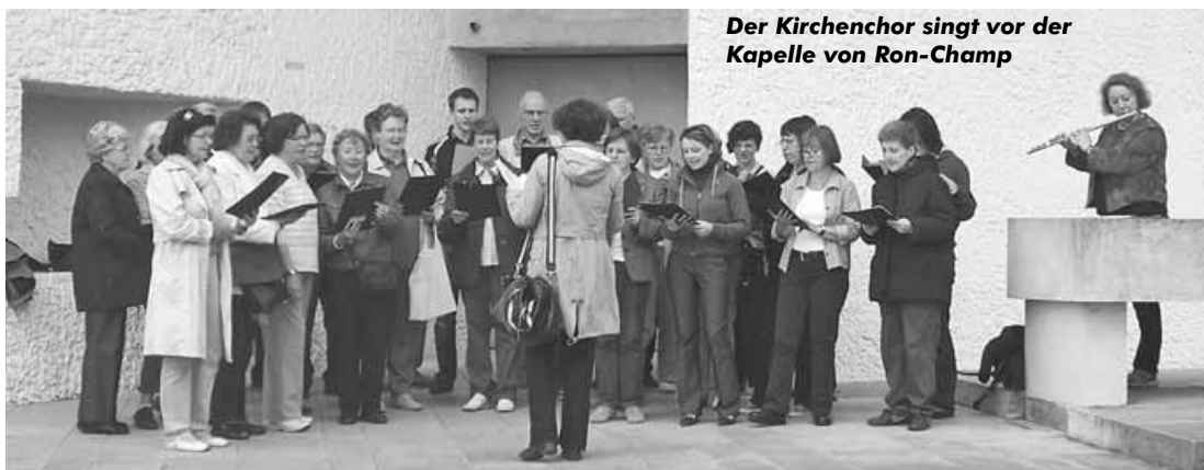
Der Kirchenchor singt vor der Kapelle von Ron-Champ

Im Mittelteil des Konzerts spielten Vesouler Künstlerinnen 4 Stücke für Orgel und Brat-