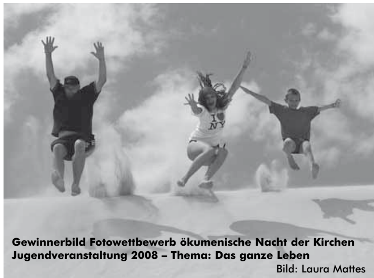
Gewinnerbild Fotowettbewerb ökumenische Nacht der Kirchen Jugendveranstaltung 2008 – Thema: Das ganze Leben

Es ist manchmal schwer, Freude zu tanken und sie zu leben.