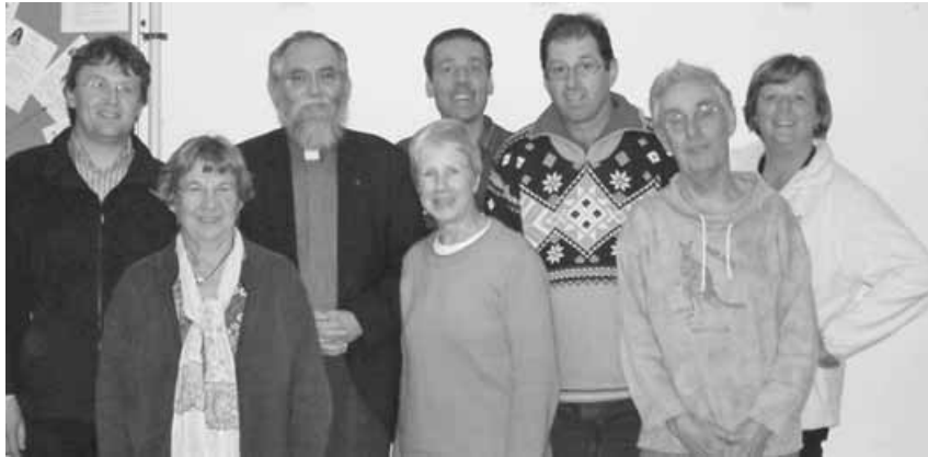
English Bible Study Group – Anwesende am 16. Oktober '09

Details zu den englischsprachigen Aktivitäten der Petruskirchengemeinde finden Sie auf der Homepage im Internet unter „ English Language Activities “ (English Language Church Service , English Bible Study Group , English Playgroup Gerlingen).