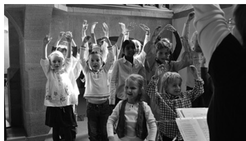
Froh gelaunte Kleine Archekinder beim Kleinen Gottesdienst