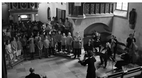
Die Große Arche singt auch schon mal mit Orchester (Pfingstkantate Zungen von Feuer)