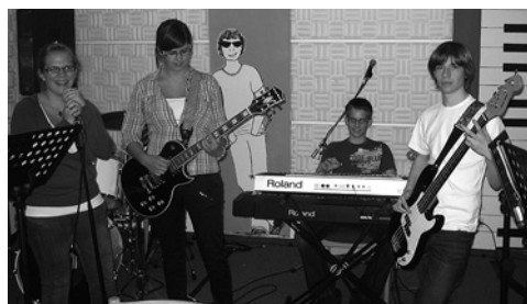
Im neu renovierten Bandraum