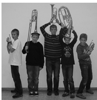
Die Yougo-Band ▶