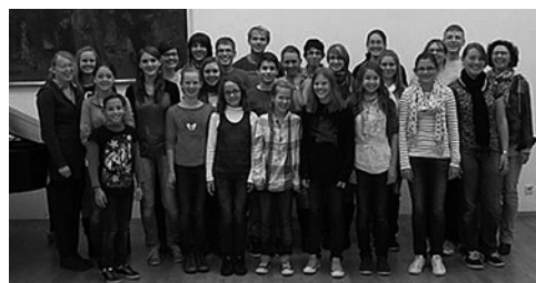
Erfreulicher Zuwachs im Jugendchor